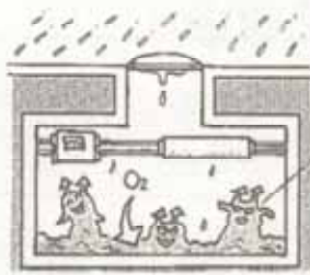
増殖した微生物の呼吸