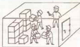
密閉された環境での酸素消費