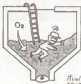
ホッパー内の穀類の呼吸