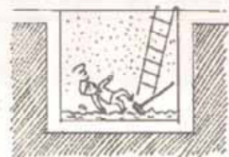
汚泥をかきまぜ硫化水素発生