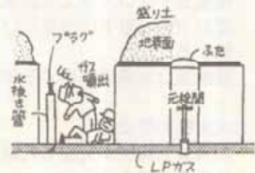
元栓を開く前にガス配管を工事