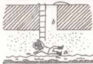
マンホール内に硫化水素滞留